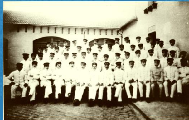
POLÍCIA SANITÁRIA SÃO PAULO 1911