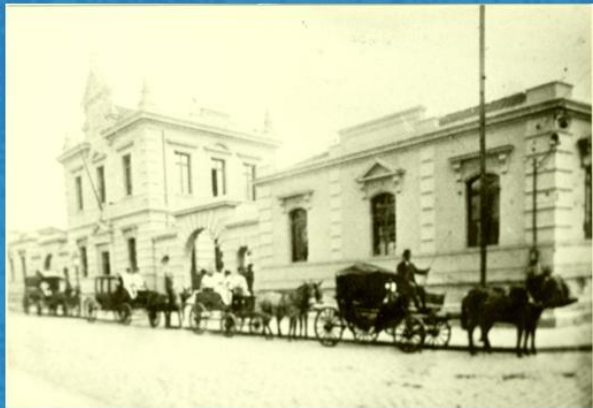
DESINFECTÓRIO CENTRAL SÃO PAULO 1902